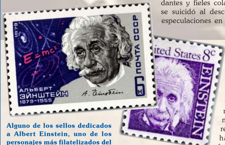
Alguno de los sellos dedicados a Albert Einstein, uno de los personajes más filatelizados del mundo.