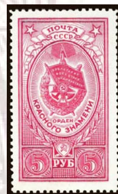
Sello de 5 rublos soviético dedicado a la Orden de la Bandera Roja, que fue otorgada a Rubén Ruiz.

La administración postal soviética, dependiente del Ministerio de Comunicaciones, emitió el 26 de octubre de 1984, un entero postal de 160 mm x 114 mm. En la parte superior derecha lleva impreso un sello de 5 kop., color lila 1 , de la serie básica de 1982, debajo del cual hay los espacios para el destino, destinatario y código postal del remitente, todo ello en color lila. En la parte superior izquierda, tiene un dibujo en colores beige, gris, amarillo y rojo, representando la efigie del español Rubén Ruiz Ibárruri de frente y, junto a él, la medalla Estrella de Oro. Héroe de la Unión Soviética, 2 , sobre hojas de laurel. Debajo del dibujo, en tres líneas, im-