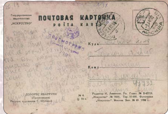
Reverso de la postal anterior. Correo de campaña, núm. 47732, del 54 Batallón de zapadores, 11ª Brigada de zapadores soviéticos. Marca de censura militar, matasellos del correo militar (21.12.1944) y de llegada a Moscú (03.01.1945).