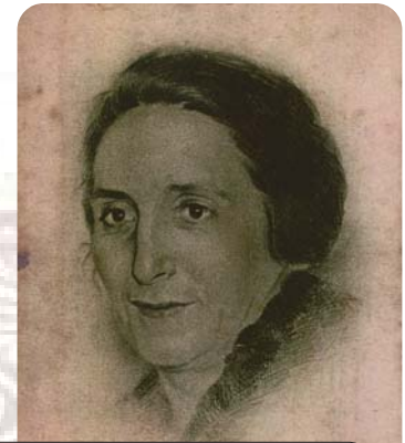
Dolores Ibárruri en una postal rusa de 1938, usada en correo de campaña en 1943.