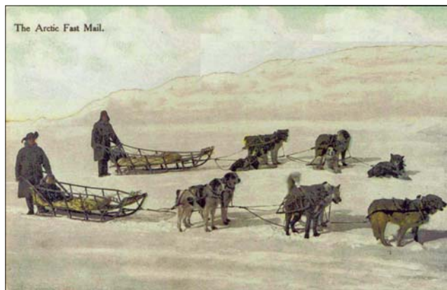
Alaska. Tarjetas postales ilustradas mostrando trineos postales tirados por perros.