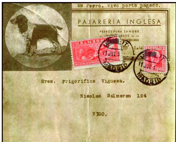
Madrid. 1935, 11 de julio. En la dirección de la etiqueta de un paquete registrado se aclara que contiene un perro vivo. Mecanografiado: "Un perro vivo". Porte pagado.

aquel siglo, sigue con la Primera Guerra Mundial, el conflicto chino-japonés y la guerra civil española, y tras la Segunda Guerra Mundial, llega a nuestros días. Cualquiera de los capítulos que completan el centenar de páginas están llenos de datos documentales y anécdotas sabrosas que no cabe aquí detallar. Como muestra, sólo lo haremos de un pasaje que afecta a España.