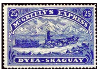
Alaska. 1898. Sello del Ex-preso de McGreely, usados en correos enviados a través de ese mensajero. La mayoría de ellos por trineo tirado por perros. Correo privado, Cat. Scott Especializado #155L1.