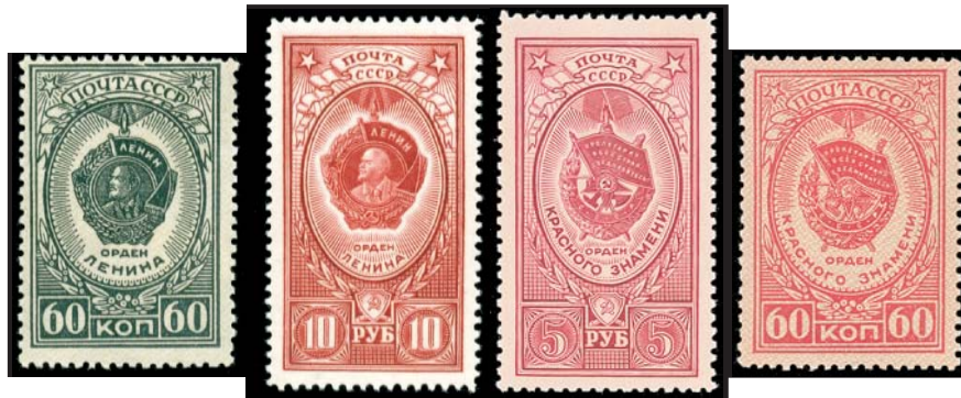
En 1963 se concede a Philby la Orden de Lenin, y en 1965, la Orden de la Bandera Roja. Sellos soviéticos con la reproducción de ambas ordenes