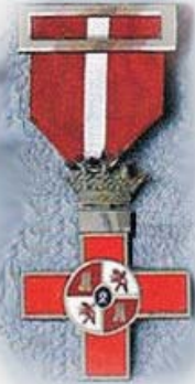
En 1938 se concedió a Harold Philby la Cruz Roja al Mérito Militar por su actuación en el frente durante un ataque a su vehículo, del que salió ileso.

fue condecorado por los “nacionales” con la Cruz Roja del Mérito Militar . El método de comunicarse con los soviéticos y pasarles información era un tanto artesano. Philby escribía cartas manuscritas con texto anodino, de tipo familiar, pero incluía su información escrita con tinta simpática. El sobre, naturalmente con remite ficticio, iba dirigido a un destinatario también ficticio, con una dirección postal de París, que era precisamente la de la Embajada de la URSS, lo que no se les ocurrió comprobar a los confiaditos censores. Al estallar la Segunda Guerra Mundial, se hallaba en Francia