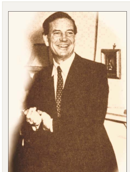
Harold Philby en una conferencia de prensa en 1951 negando ser un agente soviético

alemán Enigma , pasando sus hallazgos no sólo a sus superiores sino también a los soviéticos, sin que los ingleses sospecharan de tal filtración. Al mismo tiempo, actuó de jefe de la sección ibérica del Intelligence Service . Como tal, elaboró un dossier informando a los servicios secretos británicos de la llamada operación Bodden , un sistema de detección sónica en el fondo del mar en la zona del estrecho de Gibraltar y una cadena de 14 estaciones de observación de barcos con rayos infrarrojos en las costas española y marroquí, construido por los alemanes con ayuda española. Su puesta en funcionamiento 11 hubiera interferido con los planes aliados de desembarco en el norte de África, por lo que el Embajador británico en España, Sir Samuel Hoare, presentó personalmente el dossier Philby al General Franco, presionándole para que suspendiera la operación. Éste contestó con evasivas, pero el plan