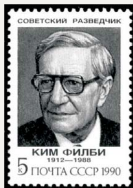
Sello soviético de 1990 dedicado a Harold (Kim) Philby

Filatelia. Los servicios postales de la URSS emitieron en 1965, un sello dedicado al espía soviético Richard Sorge, hecho hasta entonces insólito. Pero todavía lo fue más, la emisión en 1988, por los mismos servicios postales, de una serie dedicada a agentes secretos en la que destaca el ciudadano británico Harold Adrian Russell Philby quien, durante más de cincuenta años fue espía no sólo al servicio de su país, la Gran Bretaña, sino también de su gran adversario, la Unión Soviética. En realidad, se trataba de un agente doble. El sello soviético a él dedicado apareció en 1990, dentro de una serie de cinco valores. Es de formato vertical, de 23 mm x 29 mm, dentado 11½, impreso por calcografía, color gris negro y en su parte central (23mm x 26mm) se reproduce la efigie de Philby de frente, ligeramente ladeado a su derecha y con gafas, sobre fondo gris oscuro. Inmediatamente debajo de su imagen se lee: КИМ ФИЛБИ (Kim 1 Philby) / 1913 – 1988. En la parte superior del sello se lee, en letra pequeña: СОВЕТСКИЙ РАЗВЕДЧИК , sovietskii razviedchik , o sea “explorador soviético”, un eufemismo por “espía”. Su valor facial es de 5 k (kopeks) y está catalogado en Yvert , con el número 5806.