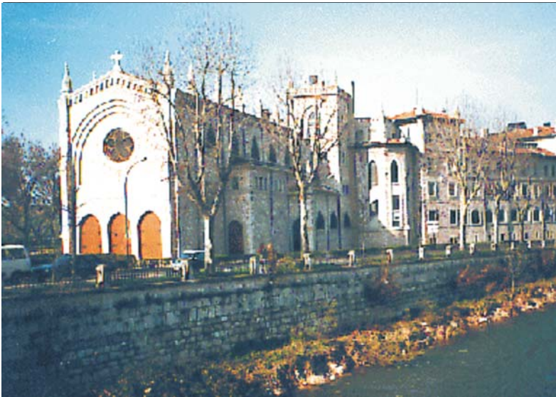
Convento de las Esclavas, Burgos, sede del Alto Mando Alemán, visitado repetidamente por Harold Philby en 1937

Tras estallar la Guerra Civil española, pasó a nuestro país en febrero de 1937, como periodista free lance o independiente 7 y, poco después, como corresponsal acreditado del famoso rotativo londinense The Times . A su llegada se alojó en el Colegio Irlandés de Salamanca con otros corresponsales extranjeros y posteriormente se trasladó a Burgos. Allí, cultivó la amistad del comandante alemán von der Osten, quien le acompañó varias veces al cuartel general de la Abwehr 8 , en el Convento de las Esclavas 9 . Para crearse una aureola derechista, sus crónicas eran altamente elogiosas de los insurrectos franquistas. En una ocasión, al visitar Córdoba, próxima al frente de batalla, y alojarse en el hotel Gran Capitán , la Guardia Civil receló de sus motivos y con pocos miramientos lo echó de la ciudad, no sin antes registrar meticulosamente todas sus pertenencias. Philby llevaba datos comprometedores escritos en letra minúscula en una hoja de papel de fumar que, aprovechando un descuido de los civiles que le registraban, logró disimuladamente llevarse a la boca y tragársela, sin despertar sospechas. En otra ocasión, en 1938, al viajar en un automóvil con otros periodistas extranjeros, un proyectil republicano impactó de lleno en el vehículo, matando a todos los ocupantes excepto Philby, quien sólo recibió heridas leves, por lo que