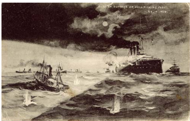
Confusión en el Mar del Norte. Cañonazos rusos alcanzan al Aurora y a pesqueros ingleses. Noche del 22 de octubre 1904.

pués, en la Conferencia de La Haya, se acordó que se concediera un plazo de asilo, en puertos neutrales, de 24 horas a buques beligerantes, más otro tanto para carbonear y un plazo prudencial para efectuar reparaciones. Pero en 1904, la decisión se adoptaba libremente en cada país. La posición de España era de estricta neutralidad, opuesta a conceder ningún plazo, a lo que se añadía la presión del Reino Unido, indignado por el ataque a sus pesqueros 8 . El almirante Rodjestvensky, desde Vigo hizo intensas gestiones y finalmente consiguió que se autorizase un carboneo limitado, pero no las reparaciones que necesitaba el Aurora . Después de este tira y afloja, el crucero malamente reparado por los medios propios y medianamente aprovisionado, zarpó de la ría de Pontevedra el jueves 27 de octubre de 1904, por la mañana, con rumbo a Tánger y la costa occidental africana.