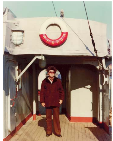
El autor en la cubierta del crucero Aurora en 1980