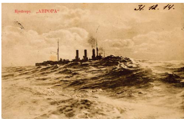
El crucero Aurora en misión de patrulla durante la Primera Guerra Mundial. Diciembre 1914.

pués, en la Conferencia de La Haya, se acordó que se concediera un plazo de asilo, en puertos neutrales, de 24 horas a buques beligerantes, más otro tanto para carbonear y un plazo prudencial para efectuar reparaciones. Pero en 1904, la decisión se adoptaba libremente en cada país. La posición de España era de estricta neutralidad, opuesta a conceder ningún plazo, a lo que se añadía la presión del Reino Unido, indignado por el ataque a sus pesqueros 8 . El almirante Rodjestvensky, desde Vigo hizo intensas gestiones y finalmente consiguió que se autorizase un carboneo limitado, pero no las reparaciones que necesitaba el Aurora . Después de este tira y afloja, el crucero malamente reparado por los medios propios y medianamente aprovisionado, zarpó de la ría de Pontevedra el jueves 27 de octubre de 1904, por la mañana, con rumbo a Tánger y la costa occidental africana.