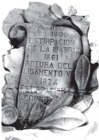
Detalle del monumento en homenaje de Federico Rubio y Galí en Madrid.