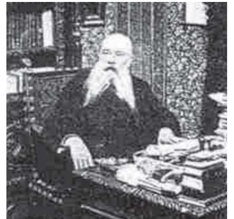
Federico Rubio y Galí en su despacho.

pasando seguidamente a París. Allí realizó prácticas en los hospitales de la Pitié y de Saint Louis, donde trabajó con el Dr. Nelanton. También practicó en el hospital de Necker, con el eminente cirujano y antropólogo Paul Broca 6 . Tras su estancia en París, pasó una temporada en Londres, realizando prácticas con el prestigioso cirujano William Fergusson 7 . También visitó el Instituto de Fisiología de Breslau, en Alemania, para conocer la técnica micrográfica, y Estados Unidos, relacionándose con eminentes cirujanos norteamericanos. Regresó a España en 1860, donde siguió cosechando éxitos en el ejercicio de la cirugía y fundó el semanario