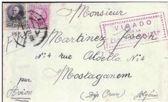
Carta remitida a Argelia por un brigadista argelino. Marcas de censura y, en el reverso, del Estado Mayor del 15 Batallón de las Brigadas Internacionales.

seguido y encarcelado por la policía británica. Tras otra estancia en Moscú se estableció en París, regresando a Moscú en 1936. Al estallar la Guerra Civil Española, Manuiski, jefe de la sección oriental de la Comintern 21 le propuso trasladarse a España para encargarse de la propaganda antifranquista destinada a los marroquíes que luchaban en el bando rebelde. Provisto de un pasaporte