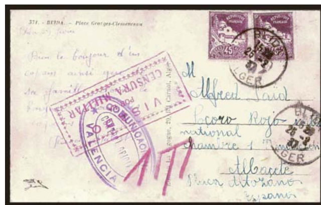
Tarjeta postal, desde Blida (Argelia), dirigida al Socorro Rojo de Albacete, Plaza de Altozano.

nombres árabes, pero sólo se indica claramente la procedencia de Argelia de 38 voluntarios: 32 procedentes de Argel, 5 de Orán y 1 de Oujda. En cuanto al resto, sólo se indica que proceden de Francia y constan como franceses, a pesar de llamarse Abderrahman, Abd-el-Kader, o nombres parecidos. Para tener la lista completa habría que ir a través de los expedientes de voluntarios “franceses”, más de ocho mil, para separar los de origen argelino. Una dificultad adicional es la defectuosa transliteración de los nombres árabes que hace que, en ocasiones, el mismo brigadista figure con dos nombres distintos, aunque parecidos. En nuestro estudio hemos procurado corregir estos defectos.