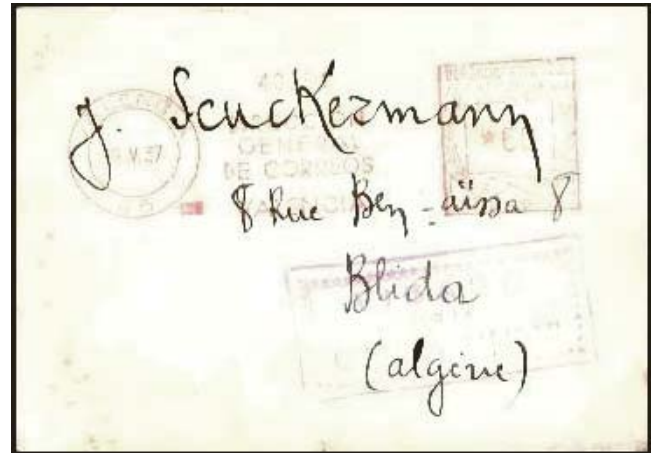
Tarjeta postal remitida por un brigadista a Blida (Argelia), vía Valencia, el 15 de mayo de 1937.

predominaban los franco belgas 38 , convertido posteriormente en el 2º batallón, Commune de Paris . Murió en combate, al frente de su batallón, el 27 de agosto de 1938, en la batalla del Ebro.