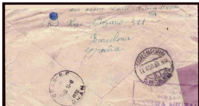
Carta aérea remitida a Argelia por un brigadista argelino. Matasellos del Correo de Campaña. En el remite, «Plaza Altozano. Barcelona».

En los archivos de las Brigadas, RGASPI, Inventario 6, que contiene los expedientes personales de los brigadistas, agrupados por países, Argelia o figura como país, ya que entonces estaba bajo el dominio francés y sus voluntarios eran considerados ciudadanos franceses. Hay que ir examinando expediente por expediente (unos diez mil) para ver si se cita alguna población de Argelia como lugar de nacimiento. Castells da la cifra total de 493 voluntarios argelinos, de los que sobrevivieron 332. En listas de voluntarios “franceses” llegados a España 31 , 110 tienen