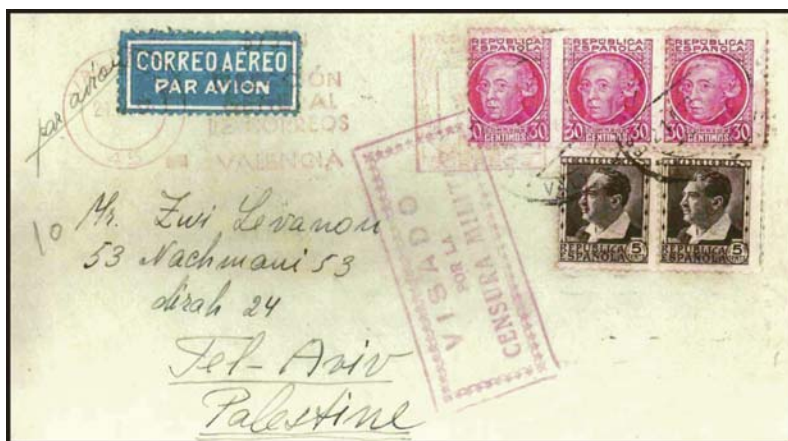
Carta remitida por un voluntario palestino de origen judío, a Tel Aviv, Palestina. Franqueada con 1 Pta. por tratarse de correo aéreo.

de la 150 Brigada (Dombrowsky). En el frente de Huesca fue herido en un brazo. Tras la disolución de la Brigada, sin esperar nuevo destino, salió por su cuenta y riesgo para ofrecer sus servicios al general Miaja. En el Estado Mayor de Miaja se le pidió la documentación y al ver que viajaba sin permiso fue detenido por desertor. Entonces se pierde su pista. Al proceder a retirar los voluntarios apareció de improviso, pidiendo quedarse en España. No consta en su expediente si se le concedió o no. En su expediente hay una nota según la cual es elemento intrigante y aventurero.