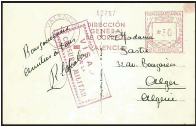
Tarjeta postal remitida en 1937 por un voluntario argelino, posiblemente de origen español, a Argel (Alger). Podría tratarse de R. Cazala, muerto en combate en 1938, en la batalla del Ebro al mando de un batallón.

Ascendido a capitán, fue asignado a la compañía de ametralladoras del 13 batallón, La Marselleise 35 , posteriormente llamado Ralph Fox (en homenaje al escritor inglés muerto en combate en diciembre de 1936). Fue herido en combate en Cuesta de la Reina, y encontró la muerte al mando de su compañía, el 17 de marzo de 1938, en Río Guadalupe, frente de Aragón. Una de las pancartas exhibidas en Barcelona, durante los actos de despedida a los internacionales, contenía una lista de voluntarios extranjeros muertos en España durante nuestra guerra. El título de la pancarta era: España será siempre la Patria vuestra . Uno de ellos era Ussidhum (erróneamente escrito Cussidhoum).