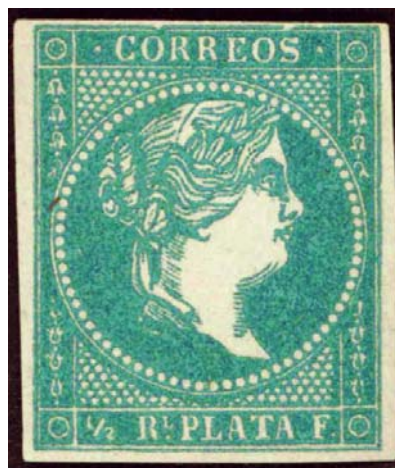
Sello de la posición IX-15, que motiva este trabajo

Esta larga introducción, tiene la intención que se conozca, que posiblemente nunca una emisión de la cuál se halla hecho un estudio ha contado con tanto material para poder realizarlo, y por eso me atrevería a asegurar, que cualquier imprecisión u observación posterior sobre esta emisión, debe demostrarse sin que quede ninguna duda, porque hay muchos aspectos complicados en su estudio, que para descifrarlos hubo que invertir varios años, y confrontar múltiples pliegos y bloques.