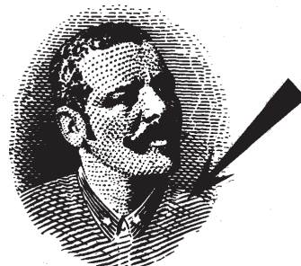
Al centro con la efígie de Antonio Maceo se le añadió dos líneas diagonales formando parte del propio dibujo.