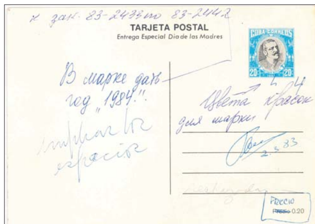
Tarjeta de 1983 con indicaciones manuscritas para la impresión en Goznak, de las tarjetas de 1984. Finalmente, la tarjeta sufrió un cambio total, el diseño del reverso fue renovado y el sello sustituido por el de Mariana Grajales.

Los cartuchos de los valores faciales fueron redibujados para ser impresos en Goznak, (URSS), entre 1978 a 1990.