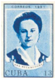
Sello de la tarjeta preparada para 1991 con esa fecha, pero sustituida después por el sello con la efigie de Ana Betancourt