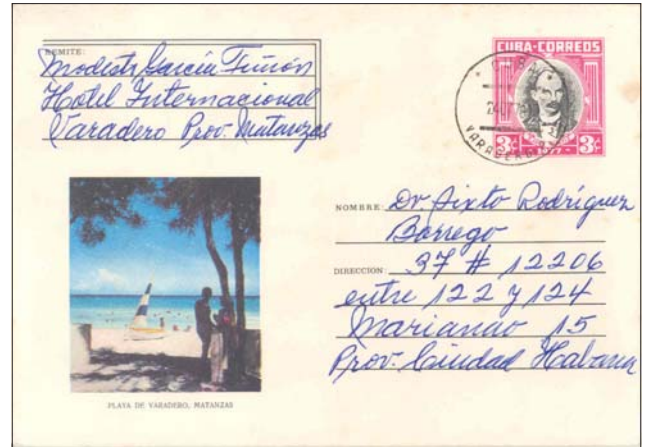
24 julio 1978. Varadero a La Habana. Sobre de 1977, con vista de la Playa de Varadero.

Los diseños fueron realizados en tinta sobre papel cromado, separados los marcos de los centros. Los sellos impresos en 1977 y 1978 tienen una medida inusual, de 27,5 x 30 milímetros, en tanto las tiradas de 1979 hasta 1984 se imprimieron con medida 19,5 x 21 milímetros, pero para todos los sobres se utilizó el mismo diseño que se confeccionó en 1977.