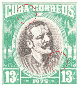
Sello nuevo a partir de copias del original de 1954. Con marcas secretas añadidas

se imprimen por primera vez tarjetas de Entrega Especial con motivo del Día de las Madres y debido a la gran demanda que se preveía de estas tarjetas, se imprimieron otras cantidades en La E.C.A.G., con las marcas secretas antes mencionadas.