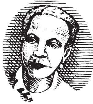
Dibujo adaptado en la URSS, al parecer se inclinó para que las líneas del fondo fueran horizontales, pero fue rechazado.