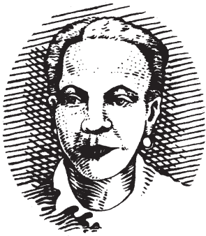
+ Liberman Dibujo original