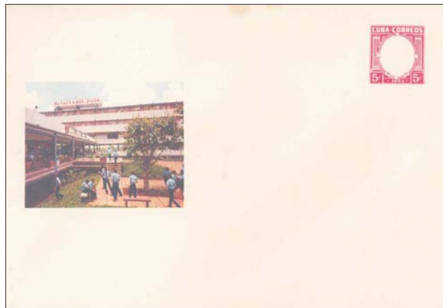
Sobre con error: sin color negro, ausencia de textos y efigie en el sello.

Se conoce un sobre con sello de 3 centavos, con la vista de LOMA DE LA CRUZ, HOLGUÍN, sin la palabra HOLGUÍN, y el texto centrado correctamente, lo que hace suponer que se trata de un error en la leyenda, que fue rectificado y vendido igualmente por error mezclado entre los normales.