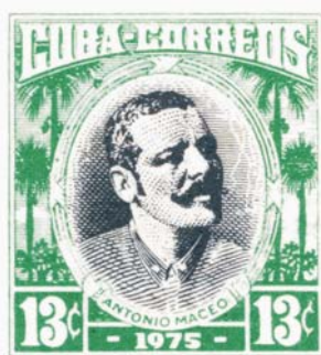
Sello nuevo a partir de copias del original de 1954. Sin marcas secretas

Llama la atención que existiendo un sello de 13 centavos, éste se imprimió con un marco diferente al utilizado para ese mismo valor en 1954, pero tiene una lógica explicación: en 1974 se rediseñó el marco y el centro del sello de 2 centavos; el marco fue adaptado para su utilización en 1975 en tarjetas para divulgación turística, incluyéndole nuevos dibujos de los centros con las efigies de Antonio Maceo y Calixto García. Es en este año que