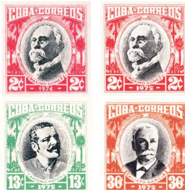
Sello de 1974 y los tres valores de las tarjetas de 1975.

Los diseños de todos estos enteros fueron realiza-