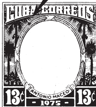
La marca secreta agregada al marco de color es una línea diagonal sobre el penacho de palma justamente debajo de las letras B y A de CUBA.