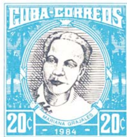
Marco de 1983 con la marca secreta sustituida por una línea continua utilizada a partir de la modificación del diseño en 1984.

Posiblemente las tarjetas más raras de todas las emitidas en Cuba sean las no expandidas de 1991, con la efigie de Mariana Grajales, se conocen solamente seis con una vista floral diferente cada una y eran totalmente desconocidas hasta ahora. En 1991, se sustituyó el sello de Mariana Grajales, por otro diferente con la efigie de Ana Betancourt.