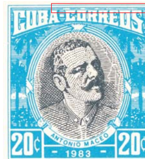
Dibujo de 1975 con lo que parece ser una nueva marca secreta añadida. Se encuentra en los enteros de 1980, 1981, 1982 y 1983