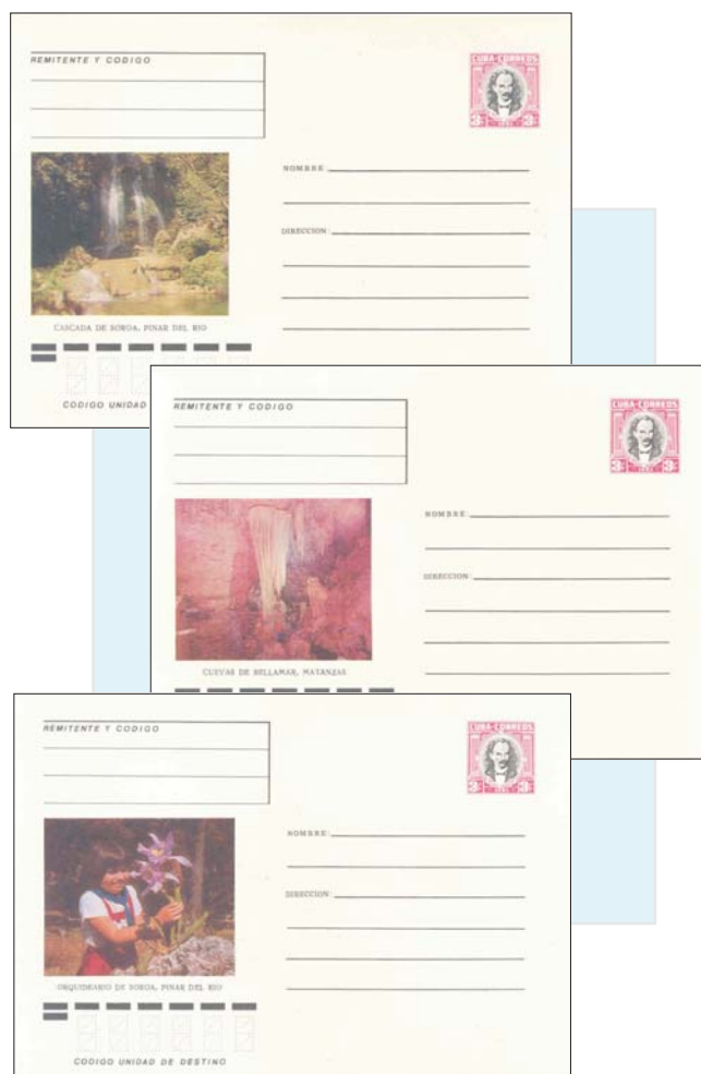
Los únicos sobres entero postales no expendidos que se conocen de estas series.

Uno de los errores de impresión más curiosos es la ausencia de la efigie en el sello de 5 centavos de la emisión de sobres entero postales 1983, con la ilustración: ESCUELA SEC. BÁS. BATALLA DE JIGÜE. PROV. HABANA, del que se conocen muy pocos ejemplares.