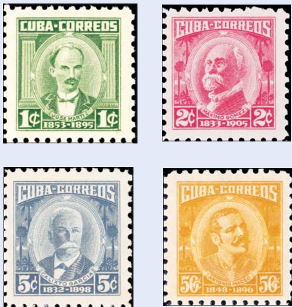
Los cuatro sellos que sirvieron de base para la realización de las tarjetas y sobres entero postales entre 1974 y 1984

b) Marco con palmas que servían de fondo a la misma leyenda colocada igualmente en la parte superior, se empleó en los sellos de 2, 5, 8 y 50 centavos y 1 peso, y posteriormente utilizado para el sello de 14 centavos por el mismo motivo antes explicado.