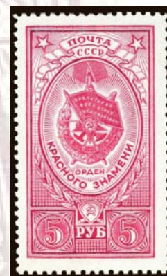
Sello de 5 rublos soviético dedicado a la Orden de la Bandera Roja, que fue otorgada a Rubén Ruiz.

La administración postal soviética, dependiente del Ministerio de Comunicaciones, emitió el 26 de octubre de 1984, un entero postal de 160 mm x 114 mm. En la parte superior derecha lleva impreso un sello de 5 kop., color lila 1 , de la serie básica de 1982, debajo del cual hay los espacios para el destino, destinatario y código postal del remitente, todo ello en color lila. En la parte superior izquierda, tiene un dibujo en colores beige, gris, amarillo y rojo, representando la efigie del español Rubén Ruiz Ibárruri de frente y, junto a él, la medalla Estrella de Oro. Héroe de la Unión Soviética, 2 , sobre hojas de laurel. Debajo del dibujo, en tres líneas, im-