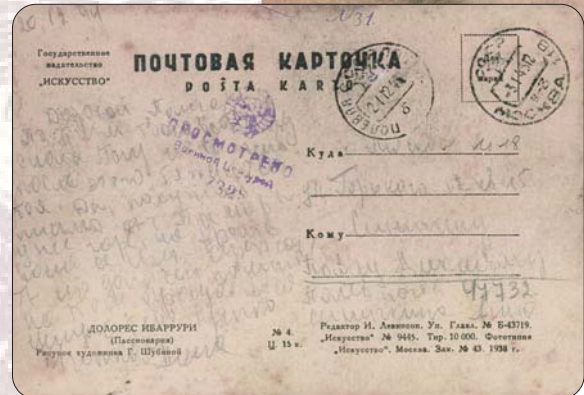
Reverso de la postal anterior. Correo de campaña, núm. 47732, del 54 Batallón de zapadores, 11ª Brigada de zapadores soviéticos. Marca de censura militar, matasellos del correo militar (21.12.1944) y de llegada a Moscú (03.01.1945).