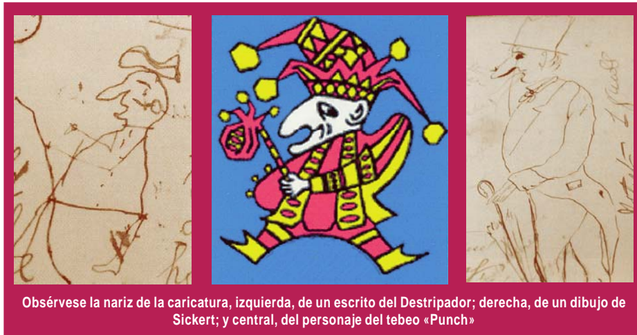
Obsérvese la nariz de la caricatura, izquierda, de un escrito del Destripador; derecha, de un dibujo de Sickert; y central, del personaje del tebeo «Punch»

Jack y ningún sospechoso. Mientras tanto, se siguen analizando más cartas de ambos sujetos. Se teme que, en la mayoría de los casos, el ADN haya sufrido degradación, debido a condiciones de conservación inadecuadas.