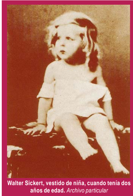
Walter Sickert, vestido de niña, cuando tenía dos años de edad.

¿Cuáles serían los motivos de Sickert? Es evidente que los crímenes de Jack no son obra de una mente sana. Aunque estos temas no se aireaban públicamente en la época, parece que al nacer, Sickert era un claro caso de hermafroditismo. En una foto familiar, a los dos años, parece una niña, sin género de dudas. Cuando tenía nueve años ya había sufrido tres complicadas operaciones quirúrgicas de sus genitales.