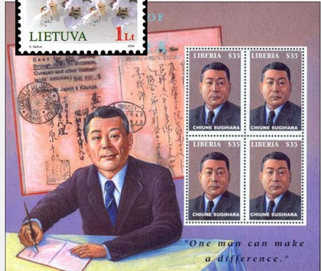
Hojita bloque de Liberia dedicada a Chiune Sugihara.

diar arquitectura. De regreso a su hogar, la familia lo envió a África del Sur, donde tenía intereses. En los primeros tiempos de la Segunda Guerra Mundial recorrió Alemania y varios países ocupados, en actividades empresariales. Al intensificarse la persecución judía en Hungría, en junio de 1944, Wallenberg fue enviado a Budapest, por decisión personal del rey Gustavo V de Suecia, como Primer Secretario de la Embajada, para salvar el máximo de ciudadanos judíos amenazados de exterminio por los nazis. Desde el primer momento, contó con el apoyo del Secretario de la Embajada y del jefe de la Legación. Ya antes de su llegada a Budapest, la Embajada sueca en colaboración con la Cruz Roja había habilitado locales bajo la bandera sueca, en los que se acogieron miles de judíos. Una de las primeras medidas de Wallenberg fue la emisión hojas-pasaporte que entregó a los judíos bajo protección sueca. El gobierno húngaro le autorizó a emitir un pequeño número de estos documentos, pero llegó a distribuir muchos miles, al tiempo que multiplicó el número de casas suecas. A fines de enero de 1945, cuando en los dos principales guetos, todavía quedaban hacinados muchos judíos, Wallenberg se enteró de los planes de Eichmann para su exterminio. Mediante gestiones personales consiguió que la matanza se cancelara en el último minuto y, al llegar los soviéticos dos días después, encontraron a 97.000 judíos todavía con vida. La cifra de ciudadanos judíos salvados por Wallenberg nun-