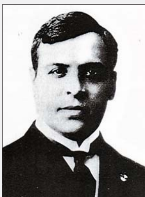
Aristides de Sousa Mendes y sobre primer día con matasellos conmemorativo.

ascendiéndolo al grado inmediatamente superior. En 1966, Israel le otorgó el título de Justo de la Humanidad , primer reconocimiento público a su abnegada labor. Burdeos le ha dedicado una calle y ha erigido un busto suyo en uno de los jardines públicos de la ciudad. La Asociación Sindi-