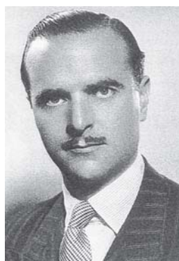
Ángel Sanz Briz, en los días de su destino en Budapest. 1944.

Sello español con matasellos de primer día dedicado al Embajador Á. Sanz Briz. 1989.