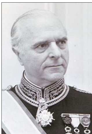
Ángel Sanz Briz poco antes de jubilarse.

la puerta de una de ellas una minúscula silueta en gris, representa un judío que se acoge a la protección española. En la parte inferior de sello figura la cifra 35 (Pta.) por el valor facial, y las palabras en rojo, «Correos» y «ESPAÑA». El diminuto pie de imprenta reza: DERECHOS HUMANOS y F.N.M.T. 6 1998. Está impreso en huecograbado sobre papel estucado engomado fosforescente, en pliegos de 50. Su formato es de 28,8 x 40,9 mm y la tirada es de 2,5 millones de ejemplares. El matasellos de primer día lleva el texto: 50 ANIV. DECLARACIÓN / DERECHOS HUMANOS / Ángel Sanz Briz I PRIMER DIA DE CIRCULACIÓN / MADRID / 10 DIC. 1998.