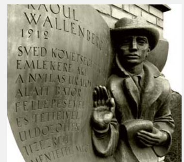
Placa conmemorativa a la entrada del Memorial Raoul Wallenberg, en Linköping, Suecia

diar arquitectura. De regreso a su hogar, la familia lo envió a África del Sur, donde tenía intereses. En los primeros tiempos de la Segunda Guerra Mundial recorrió Alemania y varios países ocupados, en actividades empresariales. Al intensificarse la persecución judía en Hungría, en junio de 1944, Wallenberg fue enviado a Budapest, por decisión personal del rey Gustavo V de Suecia, como Primer Secretario de la Embajada, para salvar el máximo de ciudadanos judíos amenazados de exterminio por los nazis. Desde el primer momento, contó con el apoyo del Secretario de la Embajada y del jefe de la Legación. Ya antes de su llegada a Budapest, la Embajada sueca en colaboración con la Cruz Roja había habilitado locales bajo la bandera sueca, en los que se acogieron miles de judíos. Una de las primeras medidas de Wallenberg fue la emisión hojas-pasaporte que entregó a los judíos bajo protección sueca. El gobierno húngaro le autorizó a emitir un pequeño número de estos documentos, pero llegó a distribuir muchos miles, al tiempo que multiplicó el número de casas suecas. A fines de enero de 1945, cuando en los dos principales guetos, todavía quedaban hacinados muchos judíos, Wallenberg se enteró de los planes de Eichmann para su exterminio. Mediante gestiones personales consiguió que la matanza se cancelara en el último minuto y, al llegar los soviéticos dos días después, encontraron a 97.000 judíos todavía con vida. La cifra de ciudadanos judíos salvados por Wallenberg nun-