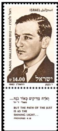
Sello de Israel dedicado a Raoul Wallenberg

Israel emitió el 7 de junio de 1983, un sello dedicado al diplomático sueco Raoul Wallenberg, que había sido designado Justo de la Humanidad 7 por su labor en Hungría durante la Segunda Guerra Mundial salvando la vida a miles de ciudadanos judíos. El sello (Yvert, n° 876), de 14 ( shekels ), fue impreso por fotograbado, de color castaño, de formato vertical (23 mm x 36 mm), dentado 14 x 13 y con dos bandas fosforescentes, representa la efigie del diplomático, ligeramente ladeado hacia su izquierda. En su parte superior derecha figura la palabra ISRAEL, en letras latinas y árabes; en la inferior, el valor (14.00) en cifras árabigas y hebreas y, en su lado izquierdo, RAOUL WALLENBERG 1912 8 . En su bandeleta inferior se lee la inscripción en letras hebreas y latinas: BUT THE PATH OF THE JUST IS AS THE SHINING LIGHT... (pero el sendero del justo es como la luz resplandeciente...) PROVERBS 4,18. La tirada fue de 1.433,000 sellos. En 1998, la administración postal de Israel proyectó continuar con más emisiones dedicadas a otros diplomáticos que se habían distinguido en el mismo sen-