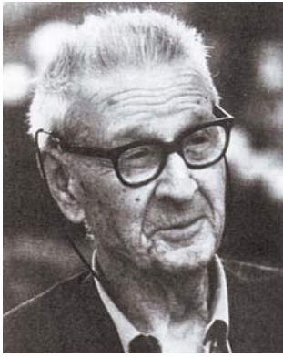
Giorgio Perlasca en su vejez. Padua, Italia.

TIVPASS No 1. En la parte izquierda de la bandeleta se reproduce un fragmento de la hoja registro de la Legación de España con el sello circular, en tinta negra, con leyenda LEGACION DE ESPAÑA - BUDAPEST, y en su círculo interior, el escudo nacional de la época.