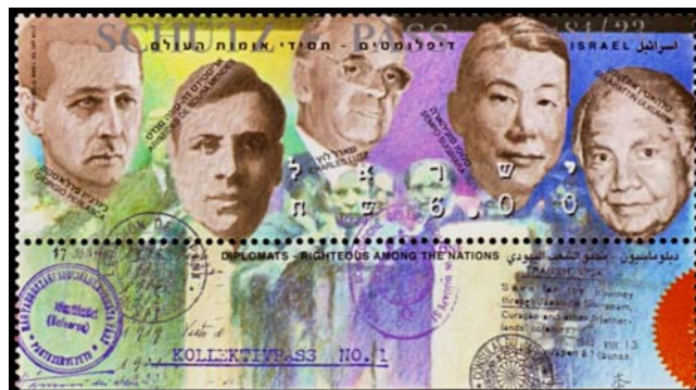
Sello de Israel de 1983, dedicado a cinco diplomáticos Justos de la Humanidad.