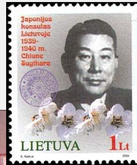
Sello de Lituania de 2004 dedicado a Chiune Sugihara.