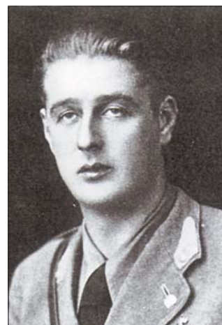
Giorgio Perlasca en España, 1936-1939.