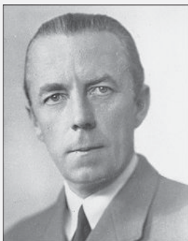
Conde (Falk) Bernadotte

Conde (Falk) Bernadotte , familiar del rey de Suecia, en la Segunda Guerra Mundial fue vicepresidente de la Cruz Roja Internacional y amparado por su cargo consiguió sacar de campos de concentración a unas 31 000 personas, de ellas entre 7 y 11 mil judíos. Para ello utilizó una flota de autobuses y ambulancias, pintados de blanco, con la cruz roja bien visible, para no ser confundidos con vehículos militares. Terminada la contienda, el 20 de mayo de 1948, fue nombrado por la ONU mediador para Palestina. Encontrándose en Jerusalén, en el curso de esta misión, fue asesinado el 17 de septiembre de 1948, por miembros del grupo terrorista judío Lehi, rama del Stern Gang , vistiendo uniforme del ejército de Israel. Este grupo se oponía a las negociaciones, ya que aspiraba a un aplastamiento militar total de los palestinos sin concesión alguna. Los asesinos fueron detenidos y puestos en libertad poco después, sin cargo alguno. Uno de ellos fue nombrado guardaespaldas del Primer Ministro israelí David Ben-Gurion. El gobierno