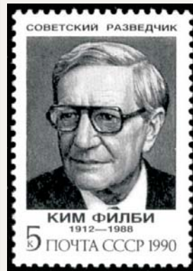
Sello soviético de 1990 dedicado a Harold (Kim) Philby

Filatelia. Los servicios postales de la URSS emitieron en 1965, un sello dedicado al espía soviético Richard Sorge, hecho hasta entonces insólito. Pero todavía lo fue más, la emisión en 1988, por los mismos servicios postales, de una serie dedicada a agentes secretos en la que destaca el ciudadano británico Harold Adrian Russell Philby quien, durante más de cincuenta años fue espía no sólo al servicio de su país, la Gran Bretaña, sino también de su gran adversario, la Unión Soviética. En realidad, se trataba de un agente doble. El sello soviético a él dedicado apareció en 1990, dentro de una serie de cinco valores. Es de formato vertical, de 23 mm x 29 mm, dentado 11½, impreso por calcografía, color gris negro y en su parte central (23mm x 26mm) se reproduce la efigie de Philby de frente, ligeramente ladeado a su derecha y con gafas, sobre fondo gris oscuro. Inmediatamente debajo de su imagen se lee: КИМ ФИЛБИ (Kim 1 Philby) / 1913 – 1988. En la parte superior del sello se lee, en letra pequeña: СОВЕТСКИЙ РАЗВЕДЧИК , sovietskii razviedchik , o sea “explorador soviético”, un eufemismo por “espía”. Su valor facial es de 5 k (kopeks) y está catalogado en Yvert , con el número 5806.