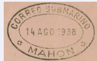
Matasellos especiales de Barcelona y Mahón, empleados en la correspondencia por correo submarino.

1938. 11 de agosto. Correo submarino. Implantación del correo por submarino para mantener la comunicación postal con la isla de Menorca. Tuvo validez postal exclusiva para el franqueo del correo submarino hasta 31 de marzo de 1939 o antes, según poblaciones.