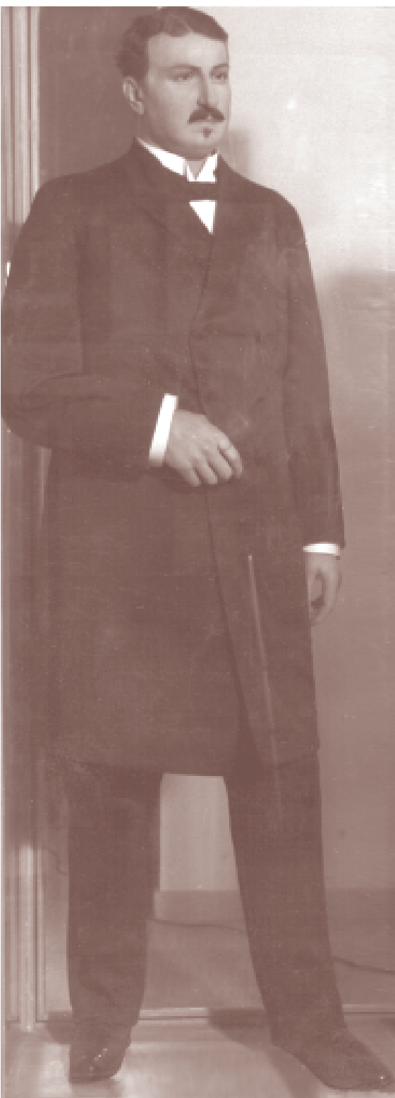
Figura de Ekenberg que se conserva en el Museo Histórico de la Policía de Estocolmo, Suecia