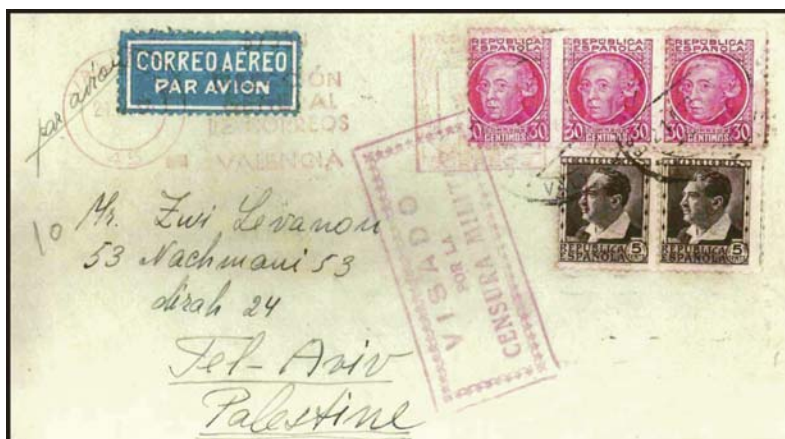
Carta remitida por un voluntario palestino de origen judío, a Tel Aviv, Palestina. Franqueada con 1 Pta. por tratarse de correo aéreo.

de la 150 Brigada (Dombrowsky). En el frente de Huesca fue herido en un brazo. Tras la disolución de la Brigada, sin esperar nuevo destino, salió por su cuenta y riesgo para ofrecer sus servicios al general Miaja. En el Estado Mayor de Miaja se le pidió la documentación y al ver que viajaba sin permiso fue detenido por desertor. Entonces se pierde su pista. Al proceder a retirar los voluntarios apareció de improviso, pidiendo quedarse en España. No consta en su expediente si se le concedió o no. En su expediente hay una nota según la cual es elemento intrigante y aventurero.