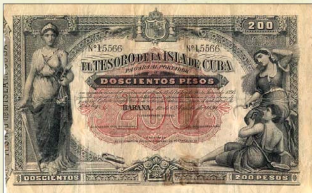
Billete de 200 pesos, emitido por "El Tesoro de la Isla de Cuba", para el pago del ejército colonial español en Cuba.

14 de la Ley de Presupuestos, el Tesoro de la Isla de Cuba emite billetes hipotecarios por valor de 5, 10, 20, 50,