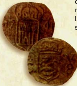
Moneda de cobre, (1741). Fundidas en Santiago de Cuba

obsidionales cubanas y las primeras en el Nuevo Mundo. Retiradas las tropas británicas, las monedas son recogidas, pero vuelven a utilizarse en 1781 y 1790.