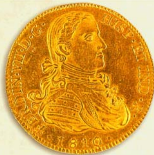
Moneda de 8 escudos, tipo Busto, (1810), Ceca de México.

22.3.1841. Se dicta una Real Orden por la Regencia Provisional del Reino disponiendo la recogida de las llamadas "pesetas sevillanas" (las cuales son aceptadas en el comercio por un valor superior al que tienen en la Metrópoli) y su posterior devolución al público por su valor real. Esta operación se realiza entre el 30 de septiembre y el 23 de octubre. La introducción clandestina