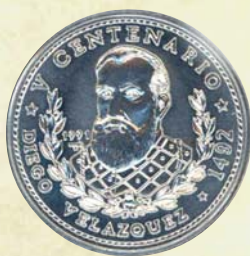
Moneda emitida en 1991, con motivo del V centenario del Descubrimiento del Nuevo Mundo, muestra la efigie de Diego