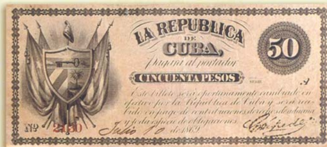
Billetes de 50 centavos y 50 pesos emitidos por el Gobierno de la República en Armas.

emiten con fecha 10 de julio en los valores de 1, 5, 10 y 50 pesos, a los que se añaden después los de 50 centavos y 100 pesos, y con posterioridad, en septiembre, los de 500 y 1000 pesos. Son grabados por la Junta Central Republicana de Cuba y Puerto Rico, impresos en Nueva York y firmados por Carlos Manuel de Céspedes, en su condición de Presidente de la República. Se consideran estos billetes como los primeros signos monetarios verdaderamente nacionales, lo que ha dado lugar a que la fecha del 9 de julio se celebre cada año como el Día de la Numismática Cubana.