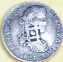
Moneda de 2 reales, resellada (1814). Ceca de Sevilla.

de las pesetas sevillanas en la Isla ha provocado grandes trastornos económicos que hacen necesaria la aplicación de esta medida, en la cual se utiliza la contramarca conocida como "resello de la rejilla".