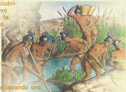
Aborígenes cubanos lavando oro.

1510. Llegan a la isla de Cuba el Adelantado Diego Velázquez y sus hombres, dando inicio a la colonización española. Las monedas hispánicas que traen en sus bolsas constituyen (si se les puede llamar así, dado su reducido volumen) el primer circulante monetario extraoficial en la Isla.