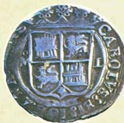
Reverso de una moneda de 4 reales de plata (1536-1555), Ceca de México, que circularon en la isla profusamente

1556. Se reciben en La Habana las primeras remesas de dinero, llamadas "situados", provenientes de las cajas reales del Virreinato de la Nueva España, las que son destinadas, en lo esencial, a cubrir los gastos militares y las