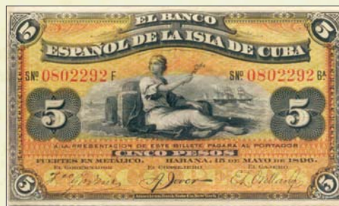
Billete de 5 pesos, emitido por "El Banco Español de la Isla de Cuba", conocidos como la "emisión de Weyler".

30.08.1896. Para cubrir los gastos ocasionados por la contienda independentista del 95 y la reconcentración decretada por Valeriano Weyler, se realiza una emisión de guerra por el Banco Español de la Isla de Cuba con billetes de 5, 10, 20 y 50 centavos y 1, 5, 10 y 50 pesos, impresos en Nueva York por la American Bank Note