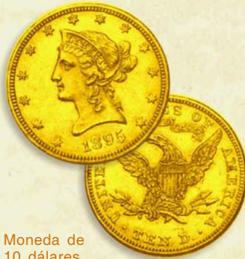
Moneda de 10 dólares, de oro, de los Estados Unidos, de amplia circulación en Cuba en las primeras décadas del s.

01.08.1898. Antes de firmarse el tratado de paz entre España y Estados Unidos, el general norteamericano Leonardo Wood, gobernador militar de Santiago de Cuba, decreta las primeras medidas monetarias en el territorio bajo su mando, entre las cuales se dispone la circulación oficial del dólar de los Estados Unidos. El primero de enero del siguiente año entra en vigor la Orden Ejecutiva del Presidente McKinley, y el dólar pasa a ser moneda oficial de curso legal en toda la Isla.