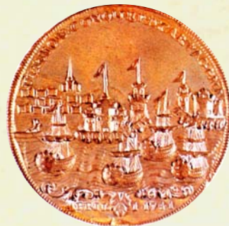
Medalla conmemorativa de la captura de cartagena por el admirante Vernón

1741. El almirante inglés Edward Vernon 1 desembarca en Guantánamo y pone sitio a Santiago de Cuba, con lo que impide la llegada de recursos a la ciudad. Esto obliga al gobernador Francisco Cagigal de la Vega a acuñar moneda con el cobre que se extrae de las cercanas minas de Santiago del Prado, para solventar las necesidades de la tropa. Son éstas las únicas monedas