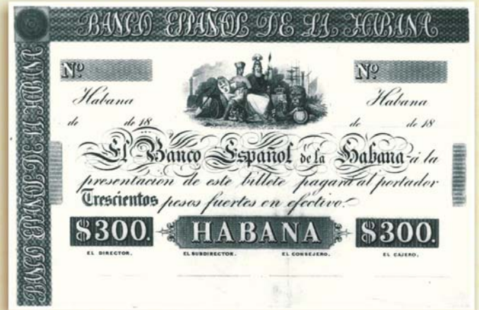
Banco Español de la Isla de Cuba. Billeto de 300 pesos de la primera emisión.

6.2.1855. Se establece, mediante Real Orden, la creación del Banco Español de La Habana, primer banco de emisión y descuento en la Isla, el que inicia sus operaciones en 1856 y al año siguiente emite los primeros billetes al portador, con las denominaciones de 50, 100,