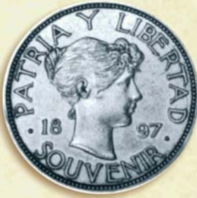
Moneda "Souvenir", emitida por "La Republica de Cuba en Armas", más adelante, en 1998, adoptada para la acuñación de la moneda de 1 peso.

1897-1898. Entre el 16 de julio y el 20 de agosto de 1897 se acuñan monedas con la inscripción "Souvenir", autorizadas por la Junta Revolucionaria de Nueva York a fin de obtener fondos, mediante su venta, para la causa de la independencia cubana. Son realizadas en tres tipos diferentes, el Tipo I por la Dunn Air-Brake Company, en Filadelfia, y los Tipos II y III por la Gorham Manufacturing Company, en Providence, Rhode Island. Su diseño re-