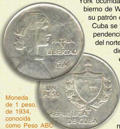
Moneda de 1 peso, de 1934, conocida como Peso ABC

22.05.1934. La quiebra de la Bolsa de Valores de Nueva York ocurrida en 1929 obliga al gobierno de Washington a abandonar su patrón oro en 1933, por lo cual Cuba se ve forzada, dada su dependencia financiera con el país del norte, a aplicar la misma medida al año siguiente. Por el Decreto-Ley # 244 quedan desmonetizadas las monedas de oro de 1915 y 1916, y al propio tiempo se abandona el patrón oro y se establece la plata como nuevo patrón monetario.