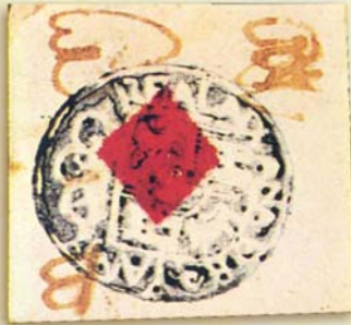
Moneda provisional. Improvisadas sobre cartas de barajas en Santiago de Cuba (1781-1788).

circulante causa serias dificultades, sobre todo en la región oriental, donde se emiten papeletas para el pago de la tropa en lugar del dinero. En 1781, por la falta de papel en Santiago de Cuba, se utilizan barajas francesas y al año siguiente se hace moneda de cartón. Su uso se extiende a las villas de Bayamo y Holguín hasta 1789.