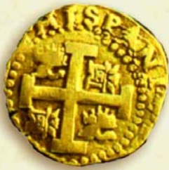
Moneda "Macuquina" de 8 escudos. Ceca de Lima, 1732.

29.5.1772. La Real Pragmática de esta fecha, promulgada en la Isla dos años más tarde, dispone la retirada de la moneda macuquina y su sustitución por la moneda de busto. La demora en la llegada del nuevo