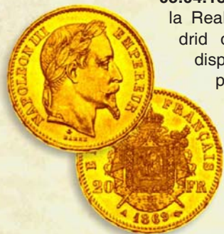
Moneda de Francia de 20 francos, comúnmente utilizada en Cuba a fines del s. XIX.

05.04.1894. Se hace extensiva a Cuba la Real Orden del gobierno de Madrid de 14 de febrero de 1891 que dispuso la admisión en las cajas públicas del reino de la moneda francesa de oro. La medida está motivada por la escasez, tanto en la Metrópoli como en las colonias, de los centenes de oro españoles, los cuales son extraídos hacia países extranjeros para ser fundidos como metal. De esta forma, el luis francés,