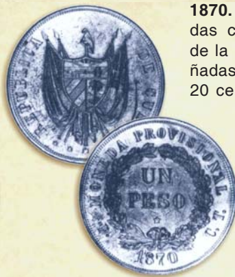
Patron de 1 peso de 1870. Acuñaado por la República en Armas

emiten con fecha 10 de julio en los valores de 1, 5, 10 y 50 pesos, a los que se añaden después los de 50 centavos y 100 pesos, y con posterioridad, en septiembre, los de 500 y 1000 pesos. Son grabados por la Junta Central Republicana de Cuba y Puerto Rico, impresos en Nueva York y firmados por Carlos Manuel de Céspedes, en su condición de Presidente de la República. Se consideran estos billetes como los primeros signos monetarios verdaderamente nacionales, lo que ha dado lugar a que la fecha del 9 de julio se celebre cada año como el Día de la Numismática Cubana.