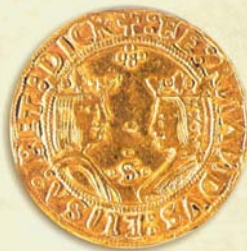
Moneda de dos Excelentes de Granada, ceca de Sevilla

1515. En el mes de agosto se fundada la villa de Santiago de Cuba. En ella circulan, desde los primeros tiempos, monedas de vellón acuñadas en Sevilla y más tarde otras de cobre, traídas desde Santo Domingo, a las que se les aplica la primera contramarca que se conoce en el Nuevo Mundo, consistente en una roseta de cinco pétalos. Este resello es también el más duradero, pues se afirma que se estuvo utilizando, aunque de forma esporádica, hasta 1748.