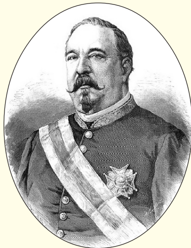
GENERAL LEOPOLDO O'DONNELL