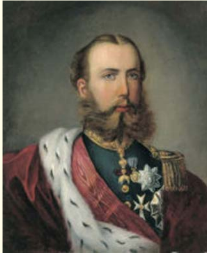
MAXIMILIANO DE HABSBURGO

Este año se conmemora el 150 aniversario de la aventura española en tierras mexicanas, conocida como la "Expedición del general Prim a México, en 1861".