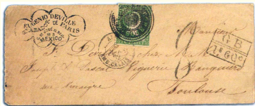
1862. Veracruz a Toulouse, Francia. Franqueada con un sello de 1 real de Antillas Españolas. Conducida por vapor francés. marca del convenio postal con Gran Bretaña. Carta 5 (5)