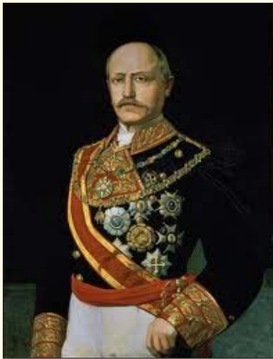
FRANCISCO SERRANO Y DOMÍNGUEZ Capitán general de la Isla de Cuba

Como resultado final de una serie de réplicas y notas, surgió el Convenio de Londres, firmado el 31 de octubre de 1861, por el cual Francia, Inglaterra y España, se comprometían a enviar fuerzas suficientes a las costas de México para apoderarse de los principales puertos y posiciones militares hasta obtener del Gobierno de aquella República la completa garantía de seguridad para los súbditos de las tres naciones y el cumplimiento de los compromisos financieros con ellas contraídos.