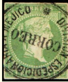
(A) DIVISIÓN "ESPEDICIONARIA"

Matasellos oficial preparado para ser usados por los expedicionarios