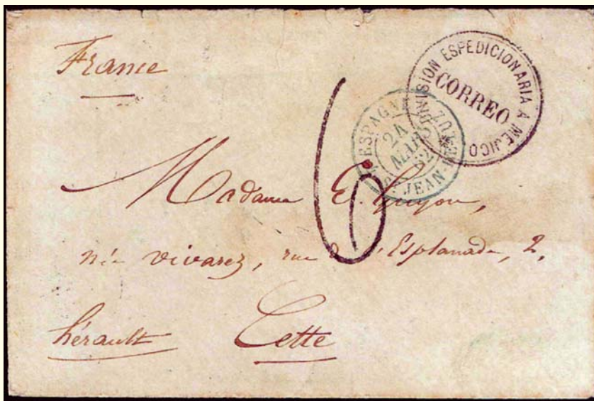
1862. México a Francia. Carta con franquicia, expedida sin sello, pero con el matasellos de la División Expedicionaria, como estaba establecido. Fechador de tránsito en Espagne - St. Jean de Luz. Tasada en Francia, cifra "6" en color negro Carta 4 (4)

para su conocimiento y en contestación de la citada carta. --Dios guarde a usted muchos años. --Madrid, 18 de enero de 1862. --Leopoldo O`Donell. Sr. Gobernador Capitán General de la Isla de Cuba. -- Hay una nota que dice: Habana, 15 de febrero de 1862. --Cúmplase, sáquese copia y pase a la Sección de Gobierno. --Serrano. Es copia. -- El secretario. -- A de Villaescusa.»