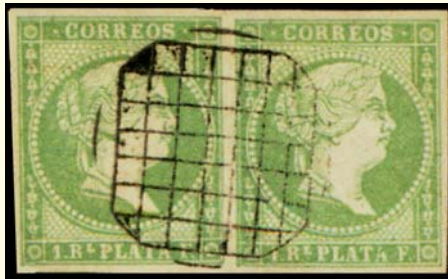
(B) MATASELLOS DE CERTIFICADO