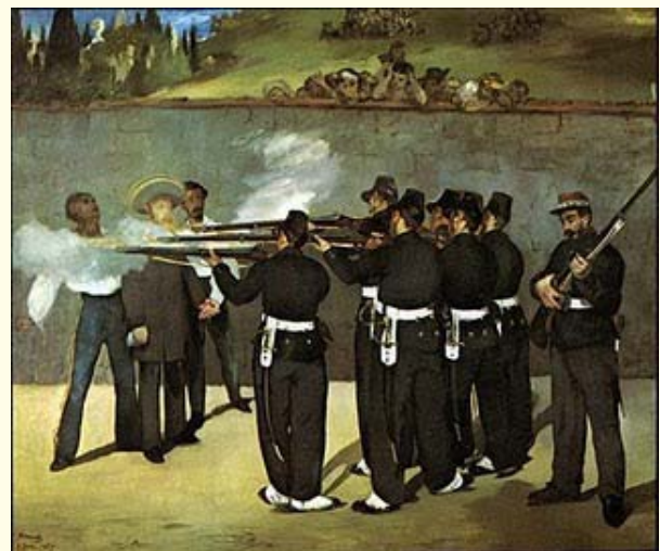
Fusilamiento de Maximiliano y sus generales Mejía y Miramón.

El fracaso de la expedición española, y por consiguiente el poco tiempo que las mismas estuvieron en campaña, hacen de estas cubiertas verdaderas joyas de la filatelia cubana, y aunque las mismas portan los mismos sellos que se empleaban en Cuba y Puerto Rico en aquella época, la identificación por sus respectivas cancelaciones, hacen que las mismas deban ser buscadas por los filatelistas cubanos, ya que fue nuestra Isla donde se tramitó, y de donde se surtió de sellos a la división Expedicionaria de México.