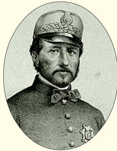
GENERAL JUAN PRIM

Coincidiendo con la llegada de Prim, arribaron las expediciones de Francia e Inglaterra, surgiendo desde los primeros momentos desavenencias en cuanto al mando, ya que cada potencia por sí pretendía el dominio de las otras. No obstante llegaron a confeccionar un pliego de condiciones para ser presentado al Gobierno de México, y se iniciaron las negociaciones, las cuales fueron rotas, por exponer sin