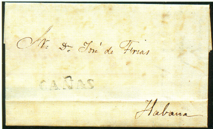
Cafetal Brucehall, Las Cañas - La Habana, 5 de junio de 1841. Marca lineal de CAÑAS, en tinta negra. La carta que comentamos en este artículo.

Una nueva marca postal prefilatélica se incorpora a la historia postal de Cuba, ha sido descubierta recientemente. Se trata de una marca lineal estampada en negro del caserío de Las Cañas, perteneciente a Puerta de la Güira, Jurisdicción de Guanajay.