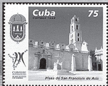
Plaza de San Francisco de Asís