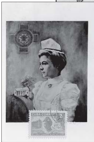
Clara L. Maass, de fondo el Hospital de Las Ánimas en Cuba

niendo a nueve de sus soldados a la picadura del mosquito en agosto de ese año. Ninguno murió. Un mes más tarde, el Dr. Jessie W. Lazear también se expuso a la picadura y murió el 25 de septiembre (muerte que el ejército calificó de «fiebre amarilla accidental»).