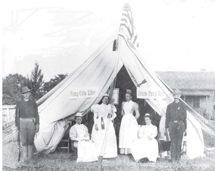
Clara L. Maass, de pie a la derecha, en un hospital de campaña en Cuba, cuando se llevaba una incesante lucha contra la fiebre amarilla

Clara conocía bien el significado de la palabra trabajo. Estando aún en la escuela primaria, empezó a trabajar como niñera en una casa, en la que realizaba desde labores de limpieza hasta de alimentación de niños a las 3 de la madrugada. El pago que le daban por su trabajo era comida, una habitación propia y tiempo