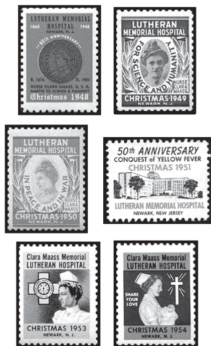
Viñetas en recordación de Clara L. Maass, emitidas en los Estados Unidos