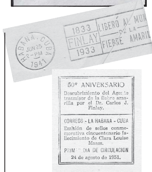
Matasellos en homenaje de Carlos J. Finlay y Clara Louise Maass

nocimiento «al carácter militar de Clara hasta el momento de su muerte».