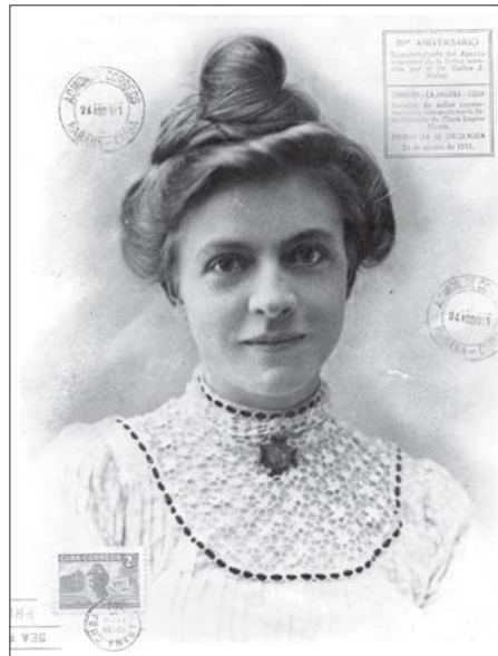
Clara Louise Maass, en su época de estudiante de enfermería

Como primogénita, los trabajos más duros recaían sobre ella, a menudo hacía de madre sustituta, enfermera sin remuneración y ama de casa. El trabajo de su padre, en una sombrerería, era eventual y muy mal pagado, por lo que la familia a menudo se encontra-