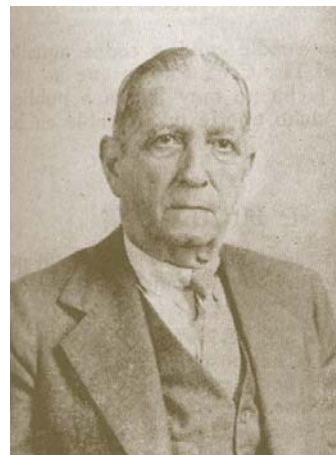
Antonio Barreras, pionero de la Historia Postal Cubana, a cuya pluma se deben los estudios más completos escritos a finales del siglo XIX y principios del XX.