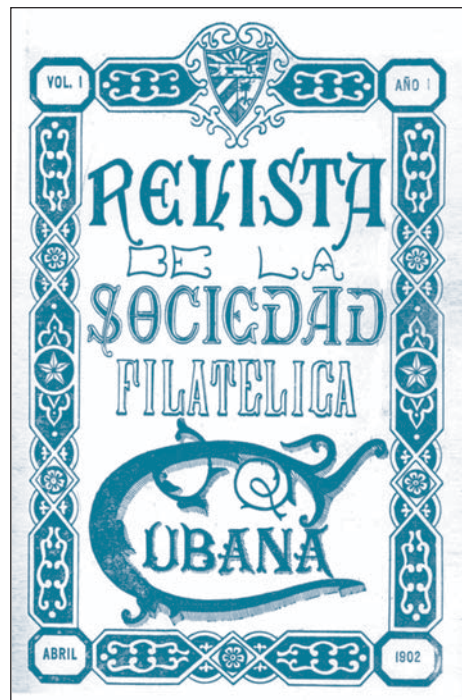
Portada del primer número de la Revista de la Sociedad Filatélica Cubana.